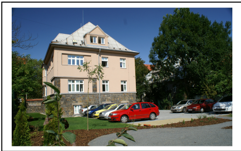
ATS MES Mükemmellik Merkezi