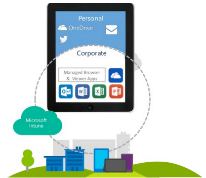
Mobile Application Management